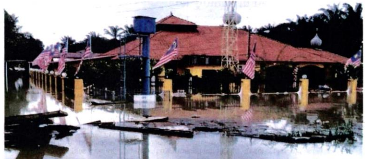
Masjid Tengku Menteri di Matang, Perak dinaiki air setinggi 1.5 meter.

Sementara itu, Jabatan Pengairan dan Saliran (JPS) negeri dalam satu kenyataan berkata, runtuhan ban di Rancangan Tebatan Banjir (RTB) Sungai Samagagah berlaku di Alor Pongsu di daerah Kerian jam 10.30 pagi kelmarin.