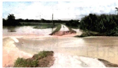
Ban pecah susulan hujan lebat di Alor Ponsu.