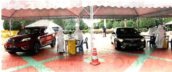
■州政府以“得来速”方式,为州议员们筛检。

他说,这次修订的目的,并不是为了这一次召开混合会议,而是为了未来可能发生的情况做好准备。