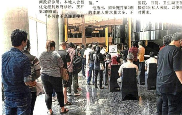
■巴生縣7間接種中心，將關閉6間，只保留益馬溫德姆酒店一間。