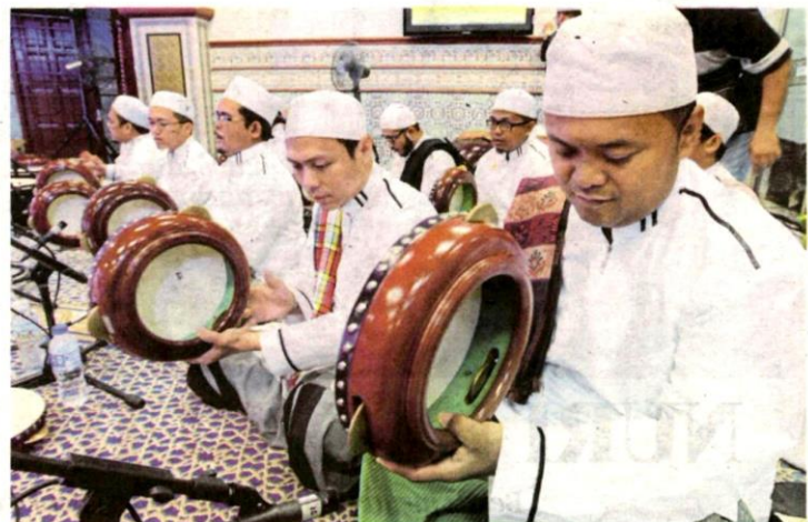
KETIKA sambutan Maulidur Rasul, selain pembacaan sirah Rasulullah SAW ada yang melakukan persembahan hadrah dengan pialuan komping.

Menurut Imam Ibn Abd al-Barr dalam al-Ist'ab setelah membawakan hadis Lahib bin Malik RA berkenaan tanda kenabian, katanya: "Sanad hadis ini daif dan kalau terdapat padanya hukum, pasti aku tidak akan menyebutkannya disebabkan perawinya majhul dan Imarah bin Zaid dituduh memalsukan hadis. Tetapi, ia mempunyai makna yang baik daripada tanda kenabian. Dalil usul bagi hadis